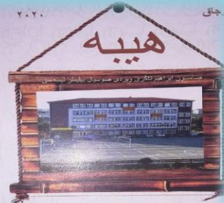
نامتون ابراهيم طائر يوردي صوصيال پوڻيئر لئسسي