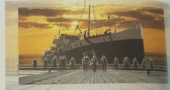
جمہوریہ گینا بول